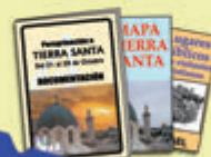
Información completa, etiquetas...