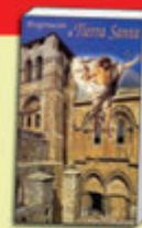
Libro-Guía de Tierra Santa