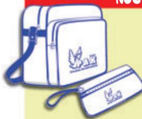
Bolsa y cartera documentación